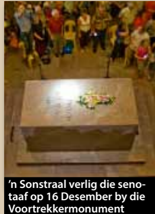
'n Sonstraat verlig die senotaaf op 16 Desember by die Voortrekkermonument

Geloftedag Die beslissende Slag van Bloedrivier het op 16 Desember 1838 plaasgevind, waar 464 Voortrekkers 'n reusagtige Zoeloe-mag van 15 000 man verslaan het. Met Dingaan se nederlaag het die geestelike bevryding van die Zoeloevolk begin. Voor die slag was daar ten spyte van dekades se sendingwerk, sover bekend, geen Zoeloe-bekeerlinge wat Christus aangeneem het nie. Ná daardie dag – Geloftedag – het die Zoeloes eers in hulle honderde, en toe in hulle duisende na Christus gekom.